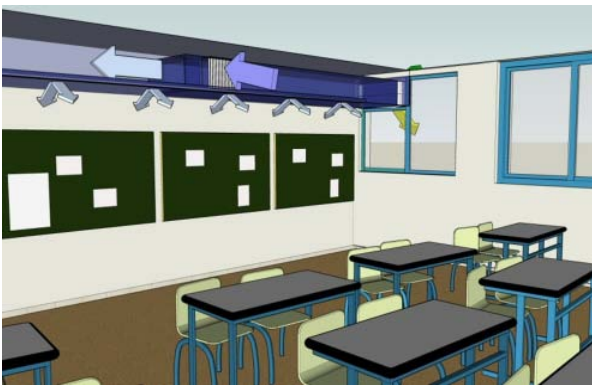
LTG gevelventilatie unit Univent ® type FVS - Inbouw voorbeeld in plafond