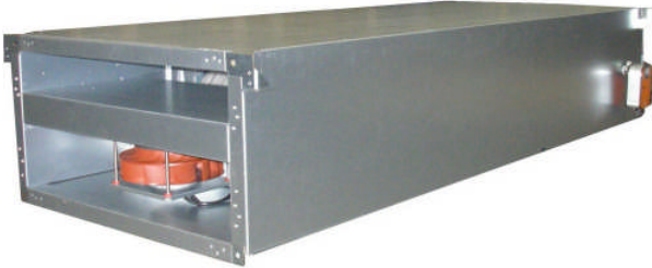
LTG gevelventilatie unit Univent ® type FVS